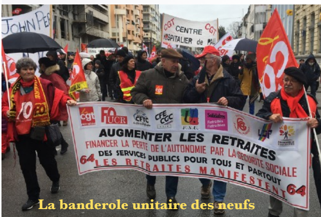
La banderole unitaire des neufs

A Pau, depuis le 5 décembre dix grandes manifestations réunissant de 2000 à 12 000 personnes ont eu lieu. Les retraités ont été de toutes ces manif. Du jamais vu dans la capitale Béarnaise.