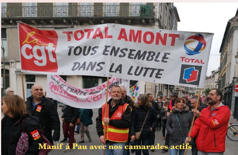
Manif à Pau avec nos camarades actifs

comme des automates. Ils ont d'ailleurs été qualifié de »playmobil », nouvelle version des godillots du temps de De Gaulle. Côté syndical, la conférence sur le financement apparaît pour ce qu'elle est. Une diversion proposée par la CFDT pour tenter de gagner du temps en espérant l'essoufflement du mouvement. Pour affoler le citoyen ils balancent des déficits à coup de dizaines de milliards. La CGT envisageait de quitter cette pantalonnade. Le plus remarquable est que le mouvement résiste. A Pau le plus de 2500 manifestant le 20 février pour